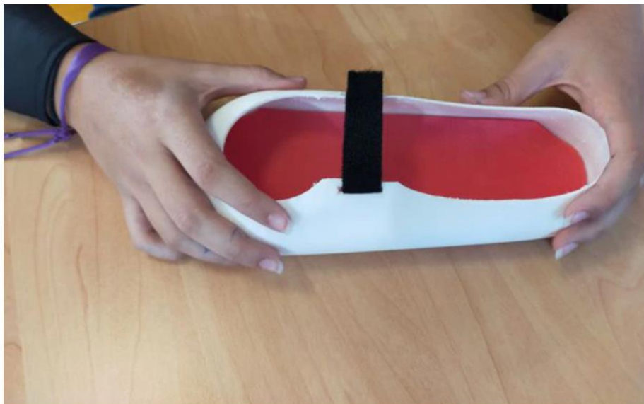
Un chausson antichute imprimé en 3D.